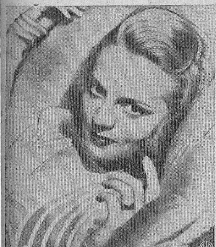
ESTA EN LA FAMILIA — Jeanne Cagney, hermana del artista del Cine Jimmy Cagney, actúa juntamente con su hermano en la obra "The Time of Your Life".