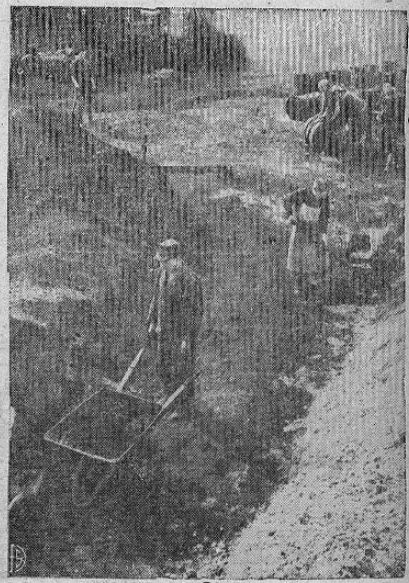
CARBÓN SINTETICO EN BERLIN. — Carbón Sintético, con seis veces más fuerza de calor que el verdadero carbón, está siendo manufacturado en el sector norteamericano para ser utilizado en la Berlín bloqueada. Hecho de acerrin, pivco de carbón y de una substancia que se parece al alquitrán, estos "trozos de carbón" se venden a 15 centavos norteamericanos, esto es mucho más barato que el mercado negro. Aquí vemos a mujeres y hombres reuniendo los ingredientes para fabricar dicho carbón sintético.

La resolución que nos hlemos este día sea pronunciada por la Cámara Segunda, ha producido el consiguiente espectáculo en el público, ya que en este caso habrá de sentarse un precedente de suma importancia por la su importancia Social Segunda.